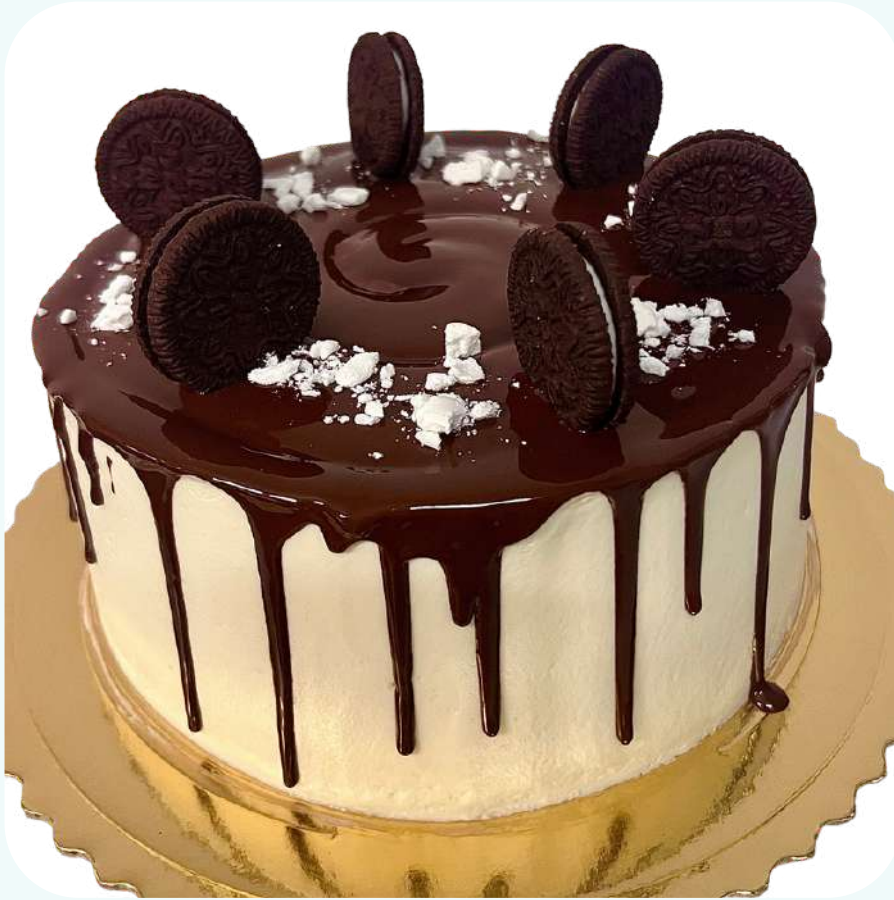
Tort bez masta (ganasz-czekolada i śmietanka)