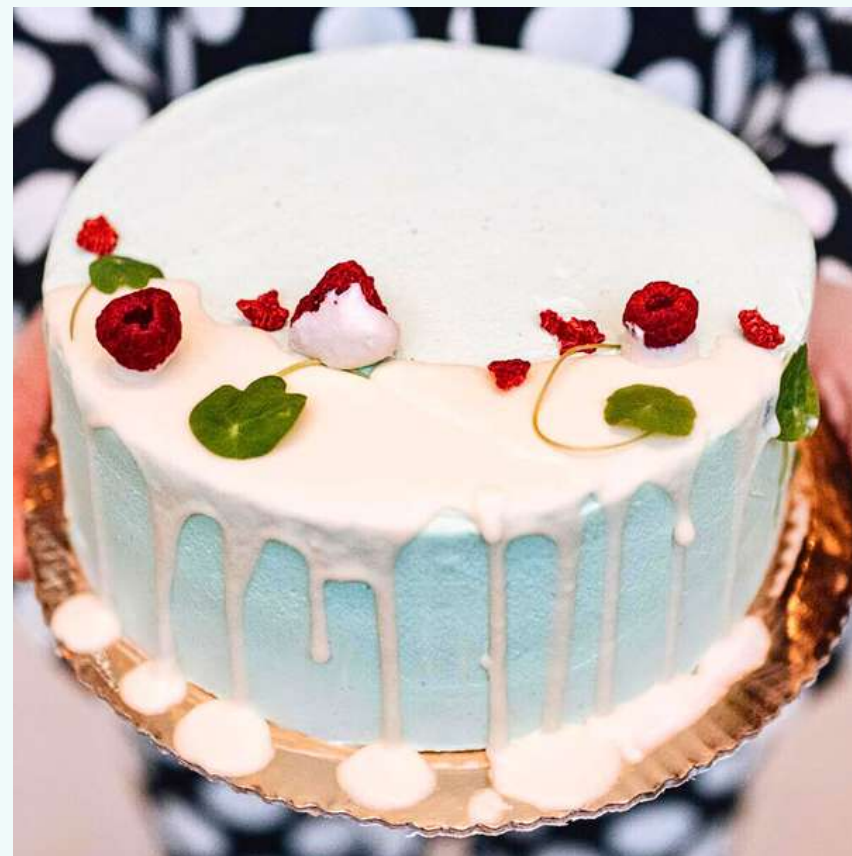
Wegański tort pistacjowy z wiśnią