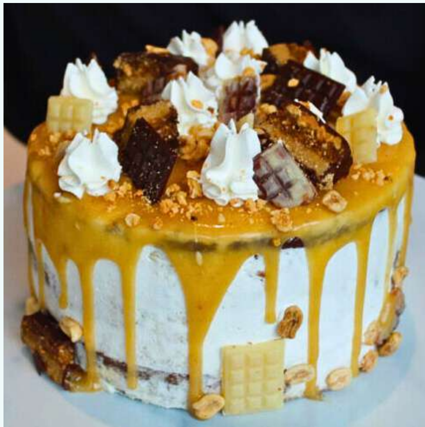
Wegański tort a'la snickers